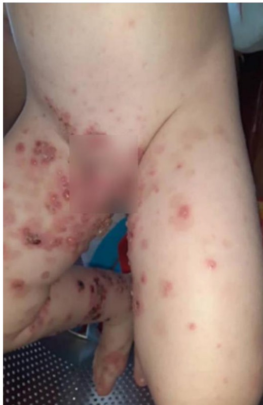
Fig. 1 - Ampollas de configuración anular en región genital, ingle y muslos, algunas asociadas a costras hemáticas.

Al ingreso se le inició tratamiento con prednisona 1 mg/kg/día, con mejoría inmediata de las lesiones, pero sin su desaparición. Se realizó biopsia de piel para análisis anatomopatológico y por inmunofluorescencia directa (IFD) ante sospecha de dermatosis por IgA lineal.