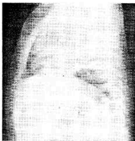
FIG. 2B. Neumonía intersticial (Bronquiolitis). Radiografía lateral. Obsérvese el descenso del diafragma, el enfisema retroesternal y el aire en intestino, indicación de polipnea intensa.

resto de los exudados arrojaron bacterias que pueden encontrarse en orofaringe sin que se les pueda achacar importancia patógena.