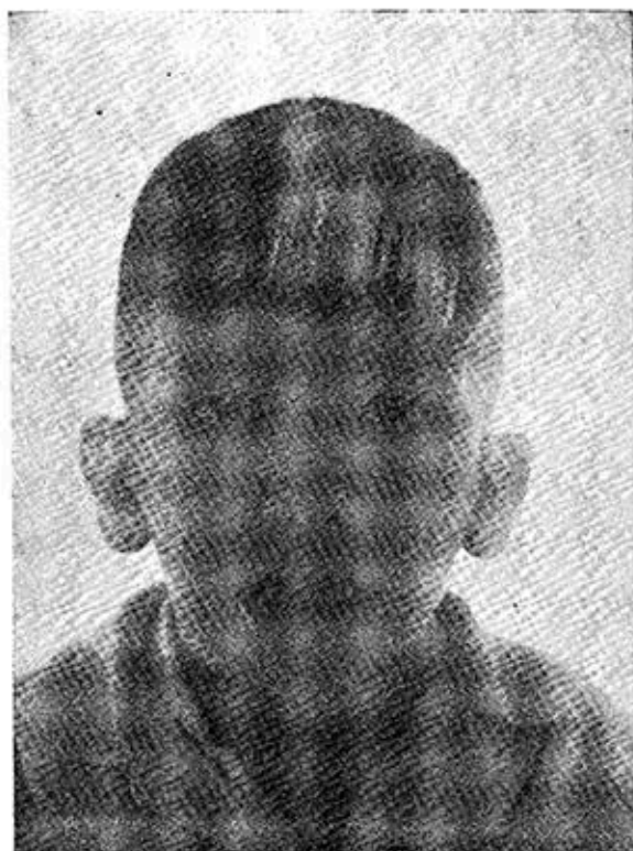
FIG. 4. Caso 2: Sólo presenta el mechón blanco, pero ningún otro signo atribuible al síndrome de Waardenburg.

La mandíbula es masiva, lo cual contribuye en gran parte a ofrecer el aspecto característico que hace que los