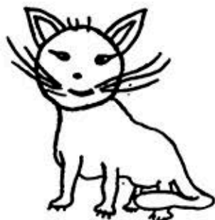
Nº 1. C. P. Animal feminoide. Edad 11 años.

palda y el fantasma. En este caso la madre (moral insanity) engañó al padre y era una mujer narcisista y seductora que convidaba a niños de 15 años a ir al cine con ella —eso les puede señalar su conducta moral. El niño escribió en el dibujo: El esposo fue matado por su mujer (engañado) y le salió el espíritu por la noche para buscarla (matarla). Ver Fig. 7, C. P.