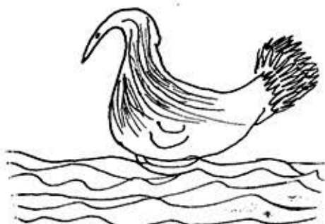
Nº 15. C. P. Animal feminoide. Edad: 8 años.