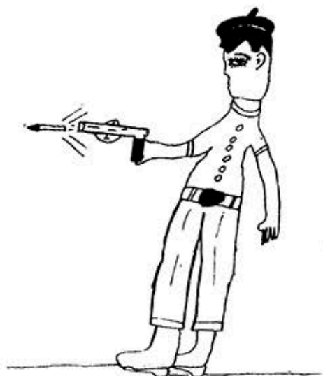
Nº 20. C. H. Hombre feminoide. Edad: 9 años.

En cuanto a las madres, predominan las sobreprotectoras y ansiosas, neuróticas, con depresiones, algunas seductoras con gran atadura a los hijos. En cuanto a las normales se puede decir igual que lo que hemos dicho anteriormente para los padres.