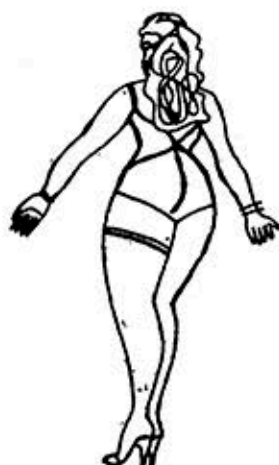
Nº 1. C. P. Edad: 11 años.

En cuanto a los hermanos y parientes hemos encontrado muchos casos en el que el niño vivía con muchas hermanas y primas, con abuelos y tías indulgentes y sobreprotectoras que ayudaban a la fijación del patrón femenino en estos niños.