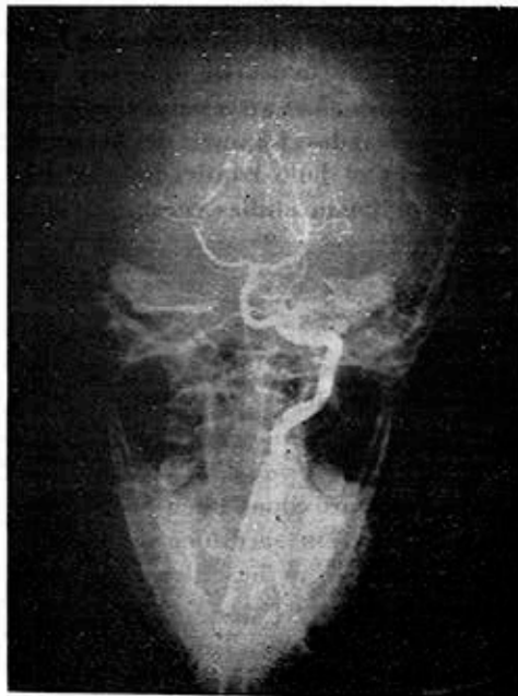
Fig. 6. Angiografía vertebral derecha. Cerebelosa pósteroinferior naciendo del tronco basilar.