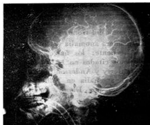
Fig. 4. Angiografía carotídea izquierda. Zona de estenosis de 50% en sífón carotídeo.

Angiografía carotídea derecha: En la arteria calloso marginal, 2 cm después