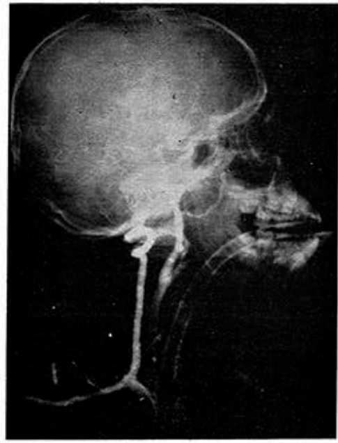
Fig. 7. Angiografía vertebral derecha.

no existiendo unión con el tronco basilar. (Fig. 5).