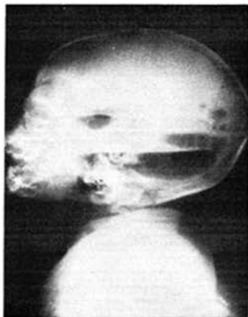
D. L. D.—H.C. 2585. Primer caso. Pneumoventriculograma.

Hidrocefalia interna marcada no comunicante. El aspecto sugiere toxoplasmosis.