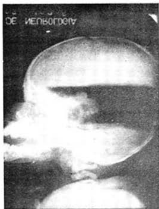
A. D. L.—H.C. 19385, Tercer caso. Pneumocentriculograma.

No penetró el aire en el tercer ventrículo ni en los laterales. Sólo existe aire en el cuarto ventrículo y parte del acueducto así como en las cisternas de la base y muy poco en los espacios subaracnoides de la convexidad. Cisternas de la base dibujadas.