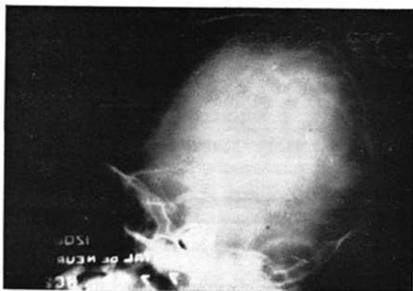
J. M. P.—H.C. 2394, Segundo caso. Rx. de Cráneo simple, Vista lateral.

Macrocefalia asimétrica, calcificaciones intracraneales supraselares.