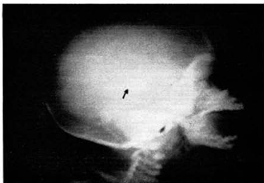
D. I. D. —H.C. 2585. Primer caso. Rx. de Cráneo. Vista lateral. Microcefalia. Pequeña calcificación intracraneal.

Evolución: Sin variación. No crisis con el tratamiento anticonvulsivante. No ha vuelto a consulta.