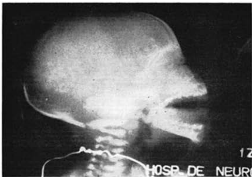
A. D. L.—H.C. 19385, Tercer caso. Rx. de cráneo simple. Vistas AP, y lateral.