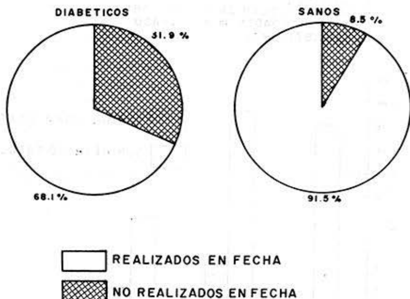
FIGURA No. 2 EXAMENES REALIZADOS EN LA FECHA SEÑALADA 1º A 6º GRADO CURSO 1970-1971