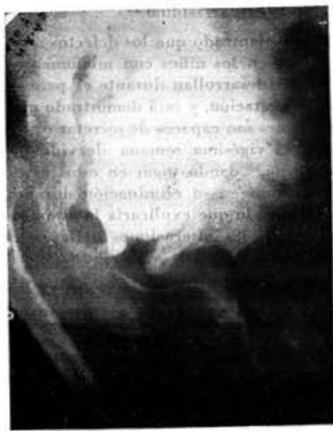
Fig. 4.—Caso 9. Vejiga grande y diverticular visualizada en la cistografía miccional.