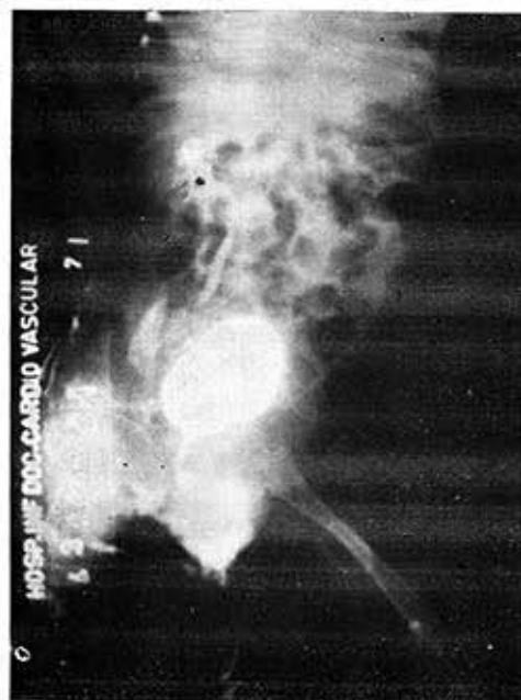
Fig. 5.—Caso 5. Se observa un gran reflujo ureterovesical derecho.