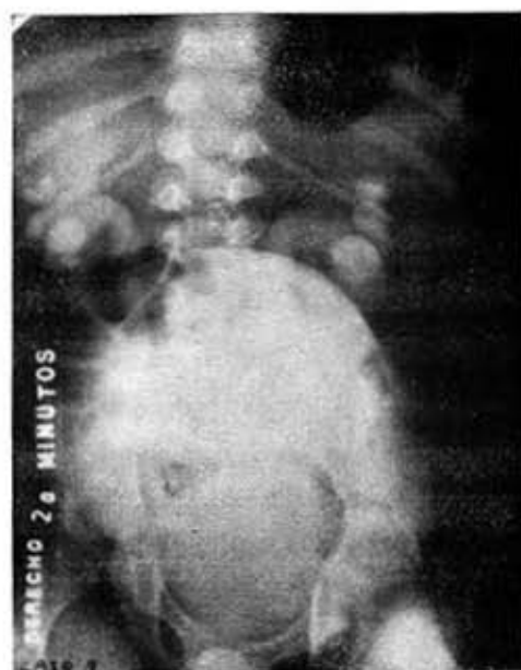
Fig. 1.—Caso 8. En el urograma se aprecia dilatación de ambos sistemas con acodamiento y dilatación del uréter derecho.