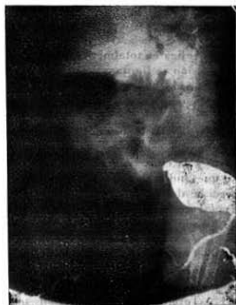
Fig. 3.—Caso 6. Vejiga piriforme con una imagen diverticular.