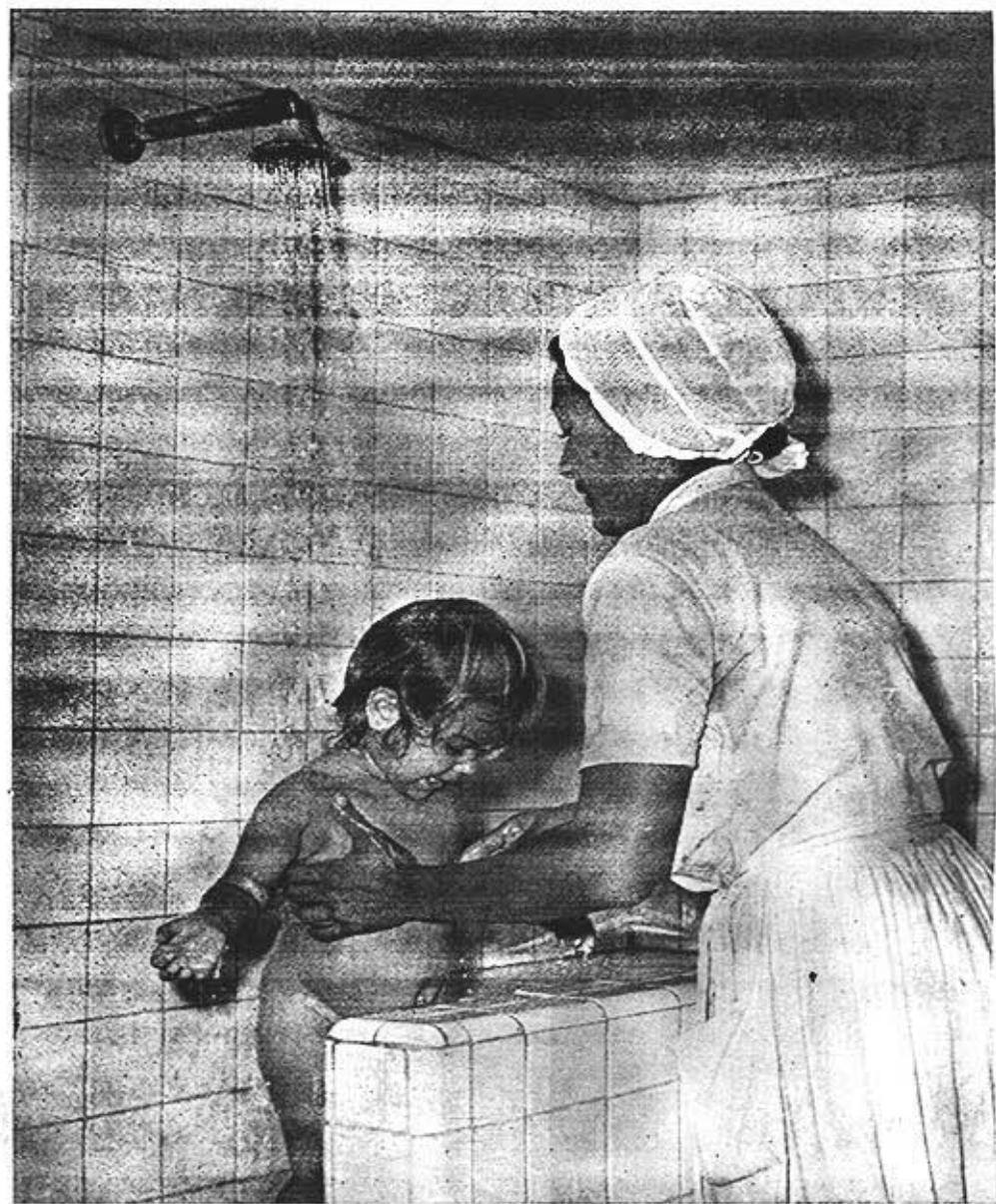
Fig. 3.—La formación de hábitos higiénicos ocupa lugar importante en la educación del niño. En el círculo infantil esto se logra con la colaboración de enfermeras, educadoras y asistentes