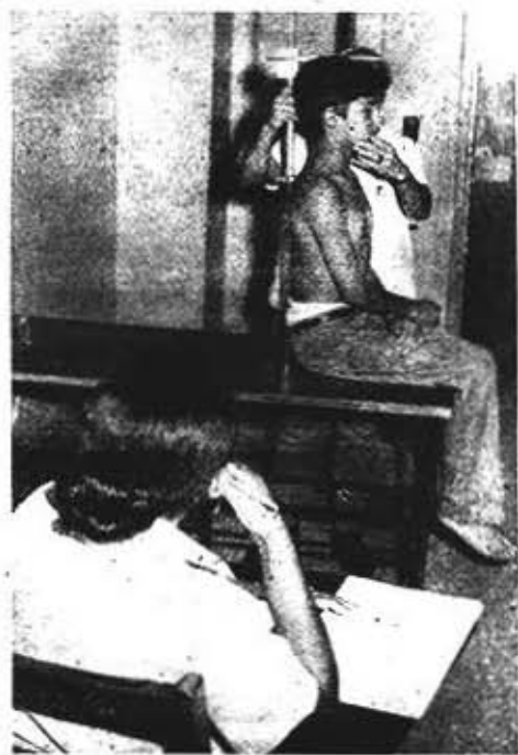
Fig. 6.—Registro de la altura del sujeto sentado durante la investigación nacional sobre crecimiento y desarrollo de la población cubana (1972-1974).