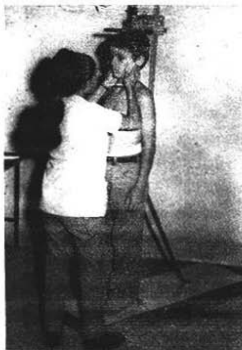
Fig. 5.—Investigación sobre crecimiento y desarrollo de la población cubana; Registro de la estatura.