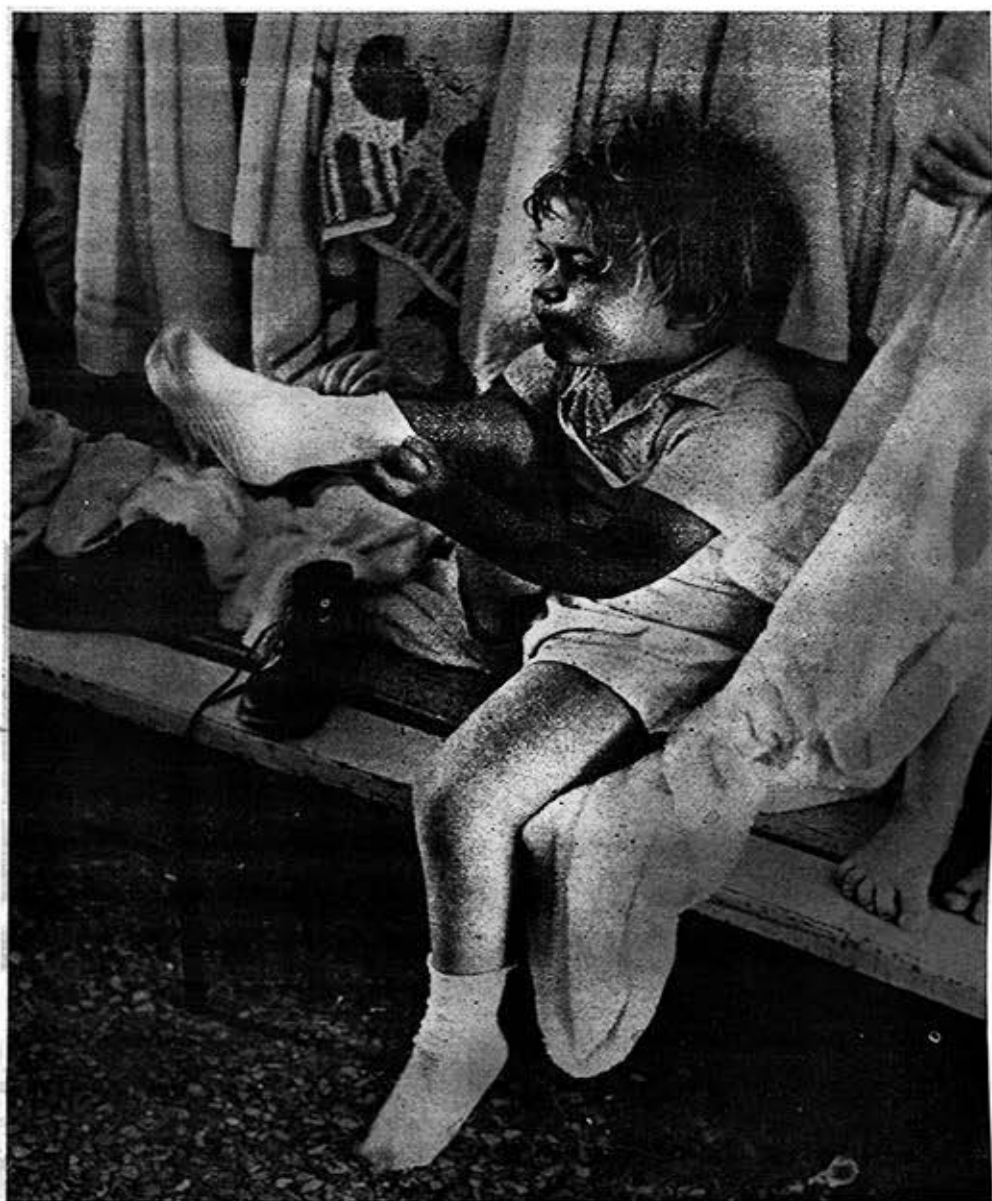
Fig. 1.—El autoservicio: un logro de incalculable valor educacional en la formación de los de los niños en nuestros círculos infantiles.