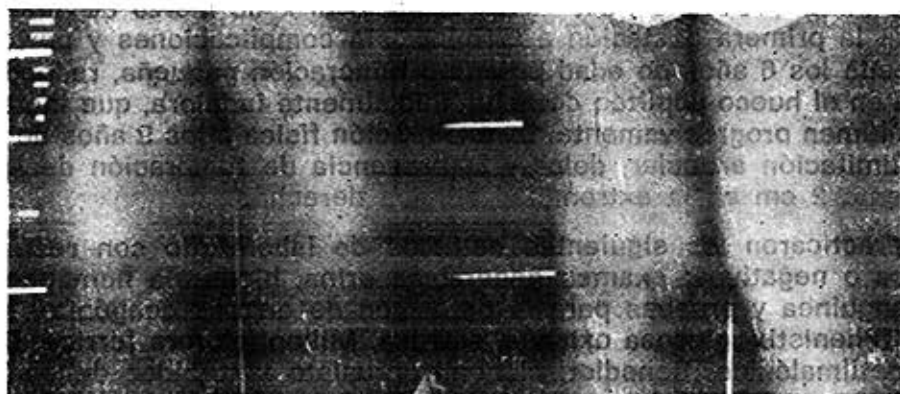
Figura 2. Nótese cicatriz quirúrgica en la propósita y su hermano después de la extirpación del quiste poplíteo.

Los padres son normales, de 30 años de edad el padre y 29 la madre al nacimiento de la propósita, originarios de una población pequeña, con un alto índice de endogamia. No se encontró historia de otros individuos similarmente afectados en generaciones previas.