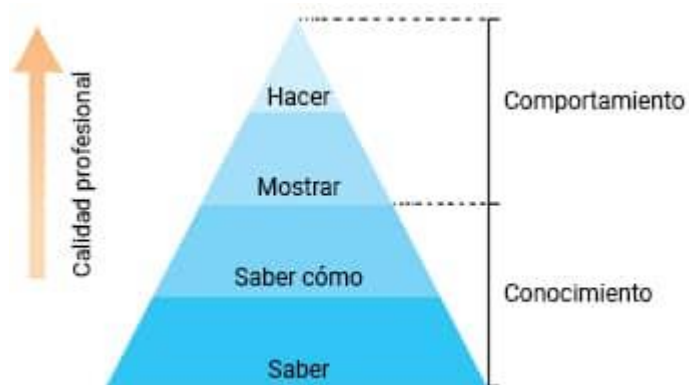
Fig. 2 - Pirámide de Miller. Modelo de competencias profesionales. (16)

Los instrumentos de medida están en relación con los estratos de la pirámide de Miller y no hay duda que la calidad profesional global se incrementa a medida que se asciende en la pirámide. La complejidad aumenta desde los simples conocimientos hasta la acción y la actividad en la vida real. Tener conocimientos (saber) no significa saber explicar cómo utilizarlos (decir lo que se debe hacer). Decir lo que se debe hacer no implica saber desempeñarse y saber desempeñarse en una situación de evaluación no implica necesariamente actuar con sabiduría y profesionalismo en la vida real. (16)