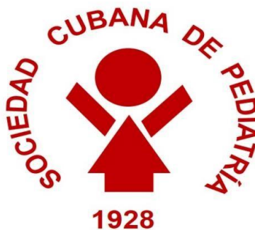
Fig. 5 - Logotipo de la Sociedad Cubana de Pediatría desde 2023 (versión en fondo blanco).

Esta nueva imagen se presentó y propuso en el balance anual de 2023, donde fue aprobada por la Junta de Gobierno ampliada, compuesta por la Junta de Gobierno de la Sociedad y los presidentes de capítulos de cada provincia y del municipio especial Isla de la Juventud.