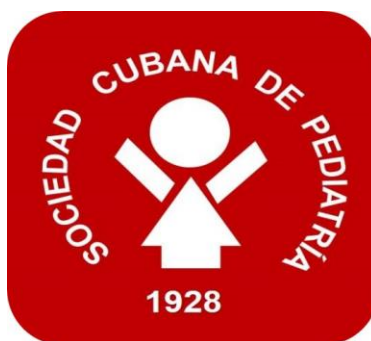
Fig. 4 - Logotipo de la Sociedad Cubana de Pediatría desde 2023 (versión en fondo rojo).