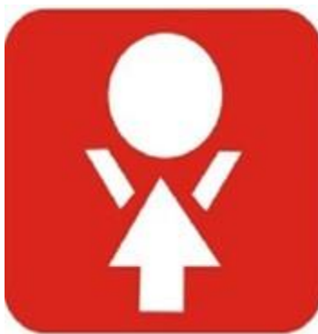
Fig. 3 - Logotipo de la Sociedad Cubana de Pediatría desde 1983 hasta 2023.

El logotipo fue diseñado con un aspecto similar al utilizado por la Sociedad Cubana de Ginecología y Obstetricia, teniendo en cuenta la estrecha relación entre ambas especialidades.