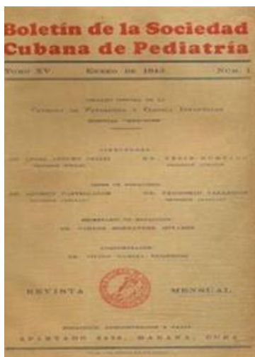
Fig. 1 - Cubierta del Boletín de la Sociedad Cubana de Pediatría .