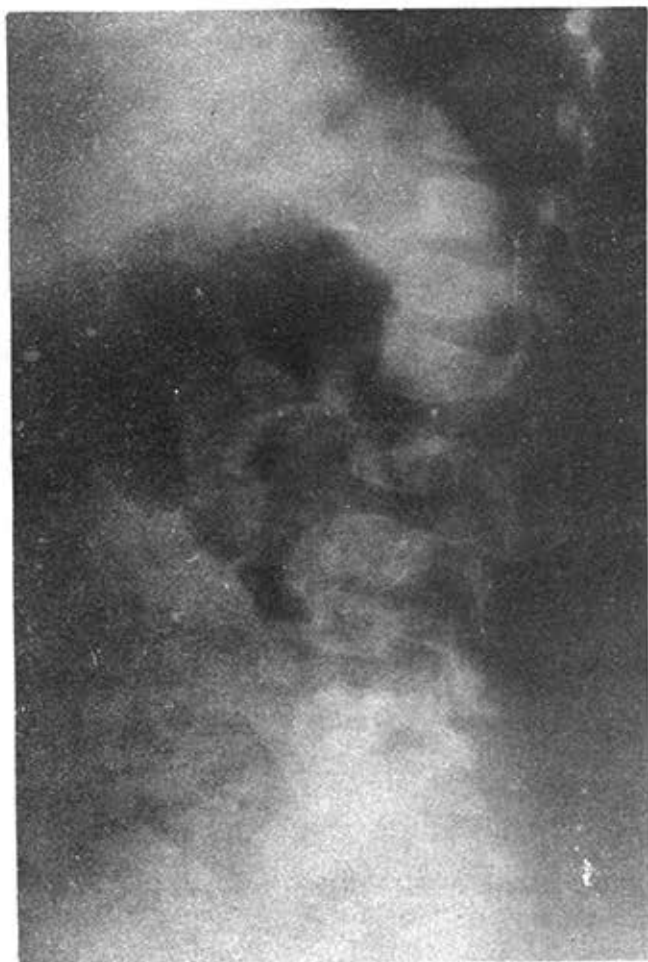
FIGURA 3. (Caso 3). Rayos X de columna lumbosacra: irregularidad del contorno de cuerpos vertebrales de L3-L4, con estrechamiento del espacio entre dichas vértebras. Periostitis del cuerpo vertebral de L5. Osteomielitis (?), TB (?).

Cuadro clínico. Refiere que al realizar ejercicios (salto), sentía dolor posteriormente en región lumbar, el cual cedía sin medicación. Consecutivamente el dolor se hizo más intenso (una semana de evolución) y le impedía caminar. En estos momentos no deambula.