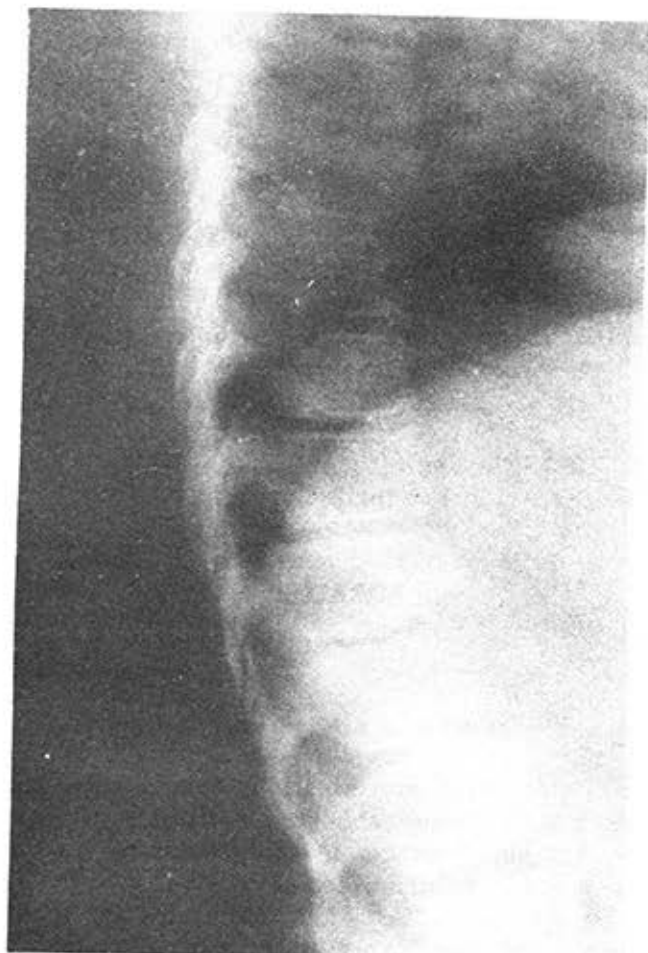
FIGURA 2. (Caso 2). Rayos X de columna: defecto óseo en parte anterior del contorno inferior de D12, con disminución en altura de éste.

A la palpación muestra dolor en región coxofemoral. En el examen se aprecia rectificación de lordosis lumbar, además de pie plano y genu valgus .