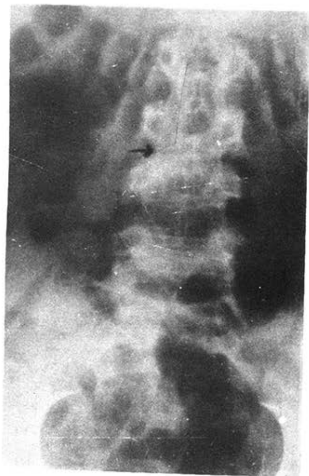
FIGURA 4. (Caso 4). Rayos X de columna: marcada disminución del espacio entre L3 y L4. Irregularidad del contorno de ambas vértebras. Osteoporosis.

El diagnóstico que se planteó fue de osteomielitis de columna lumbar en L3 y L4.