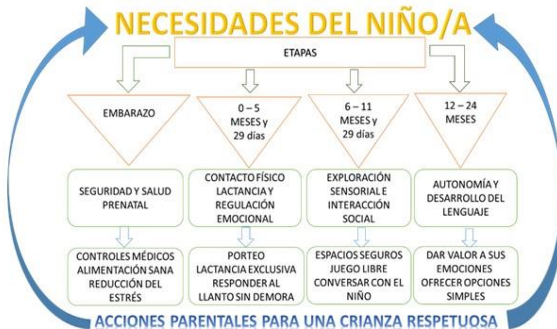
Fig. 2 - Etapas de los primeros 1000 días de vida y acciones parentales.

nutrición sana, estimulación y apego temprano, desarrollo psicomotor adecuado, formación del carácter desde la comprensión y la prevención de trastornos de conducta y enfermedades crónicas, relacionadas con esta etapa de la vida (fig. 2).